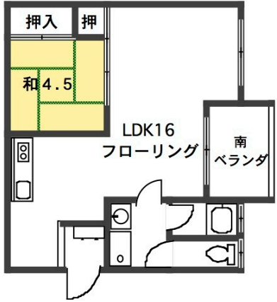
シャトーイトー 402号のみ平面図

※室内美室! 特別仕様! 平成27年8/末完成! ◎交通買い物便利! ※地デジ・BS・CS受信可! ※火災保険料(要) 2年¥20,000- ※ペット不可! 全保連保証会社(要加入) ※短期解約違約金有り「1年未満解約時は違約金として賃料の2ヶ月分を支払う事」※